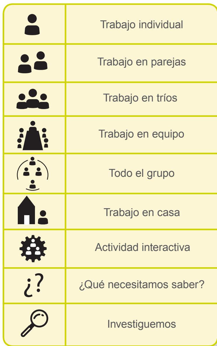
Tabla de íconos

¿para qué sirve? para visualizar y orientar el proceso de aprendizaje. ¿cómo están organizados? * Cantidad de integrantes * lugar donde se desarrolla la actividad * el tipo de actividad